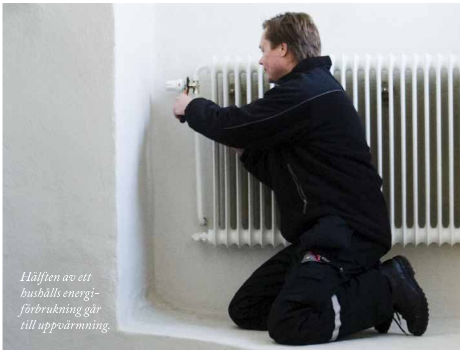
Hälften av ett hushålls energiförbrukning går till uppvärmning.