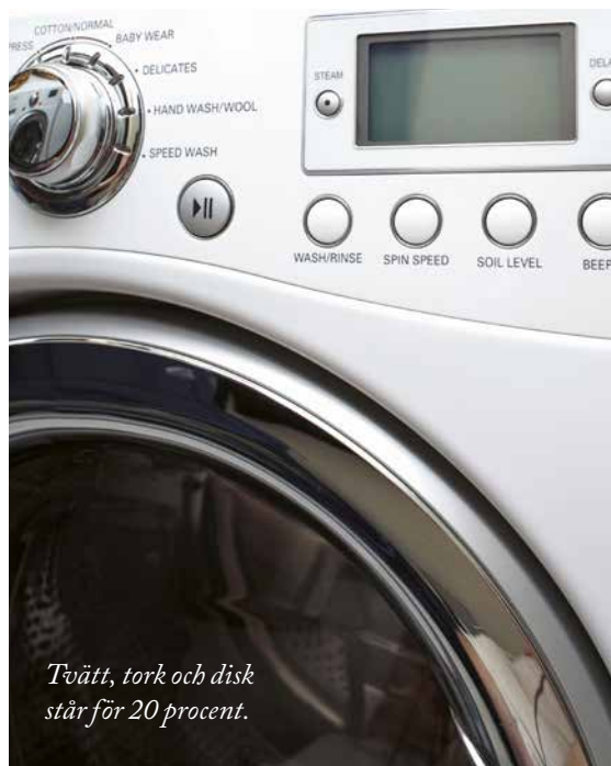
Tvätt, tork och disk står för 20 procent.

Det finns en obligatorisk energimärkning för kylar, frysar, tvättmaskiner, torktumlare och diskmaskiner. När du köper nytt, välj en energisnål modell som i övrigt motsvarar dina önskemål och behov.