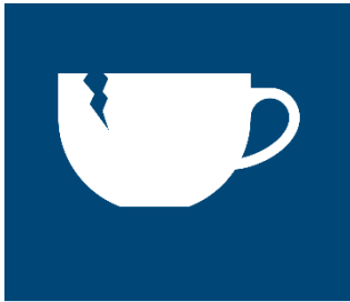
PORSLIN & KERAMIK

Vi har sett att det är svårt för många att kunna sortera ut porslin och keramik. Det är en del som lagt blomkrukor av lera och porslin, prydnadsaker av porslin och trasiga tallrikar och muggar på golvet i sop-/återvinningsrummet och i andra kärl.